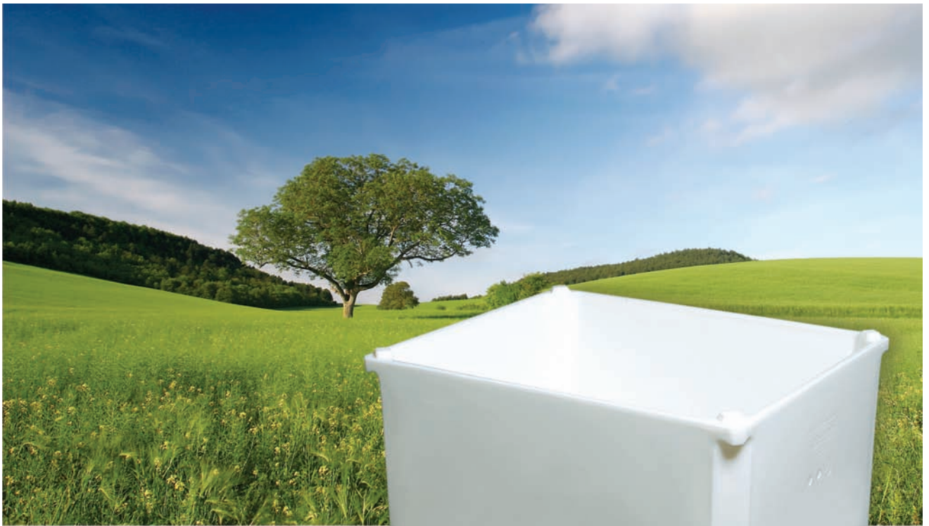
MPC Container 605