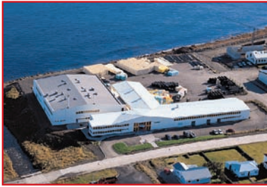
Promens Dalvik Island