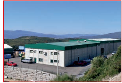
Promens Iberia Spanien

Promens ist der weltgrößte Hersteller dreischichtiger, hochwertiger Kunststoffprodukte. Als global führender Hersteller von nahrungsmittelgeeigneten Produkten fertigt Promens Container, die in allen Sparten der Nahrungsmittelindustrie eingesetzt werden können.