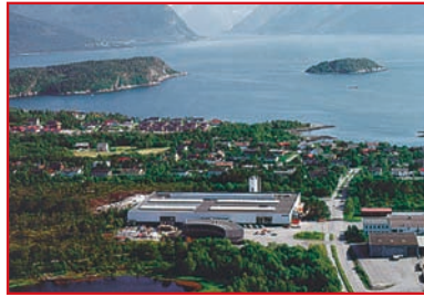
Promens Aalesund Norwegen