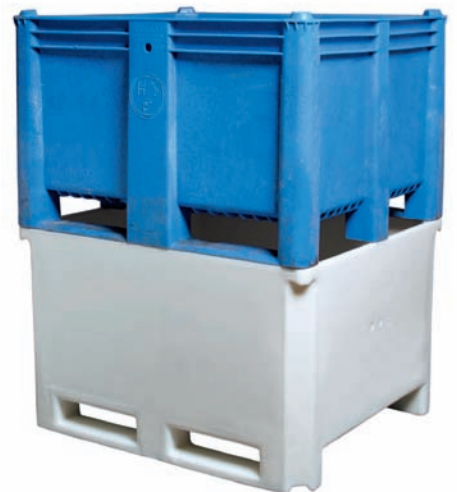
Der Sæplast 605 kann mit herkömmlichen Spritzgussboxen gestapelt werden.

Beide Container sind aus EU-, BGA- und FDA-zugelassenem, nahrungsmittelgeeignetem Polyethylen hergestellt und haben glatte, nahtlose Konturen, die eine leichte Reinigung und optimale Hygienebedingungen garantieren.